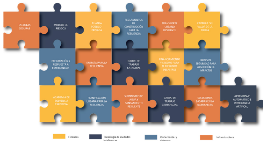
Figure 1. CRP Technical Working Groups