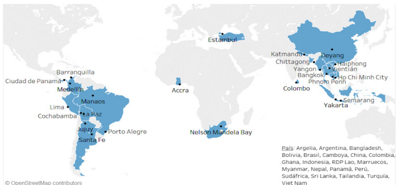
Figure 4: CRP Engagement Cities

For further information https://www.gfdrr.org/en/city-resilience-program